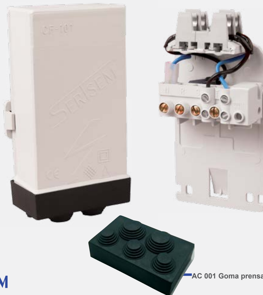
AC 001 Goma prensaestopas.