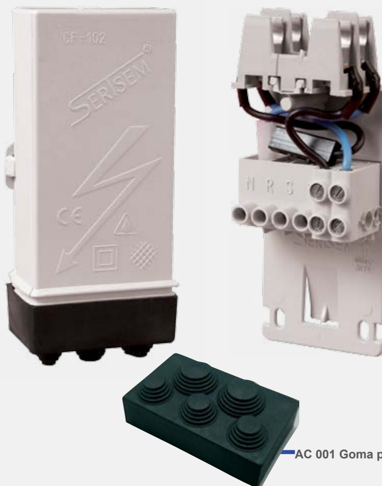
AC 001 Goma prensaestopas.